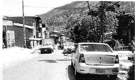
Parqueo indebido en doble fila de vehículos

La Secretaría de Movilidad agradece su comunicación y aportes en aras de mejorar la movilidad y seguridad vial de la Ciudad.