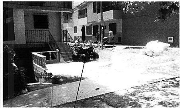
Parqueo indebido en zona verde